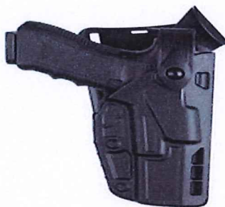
ALS/ SLS, Hood Guard